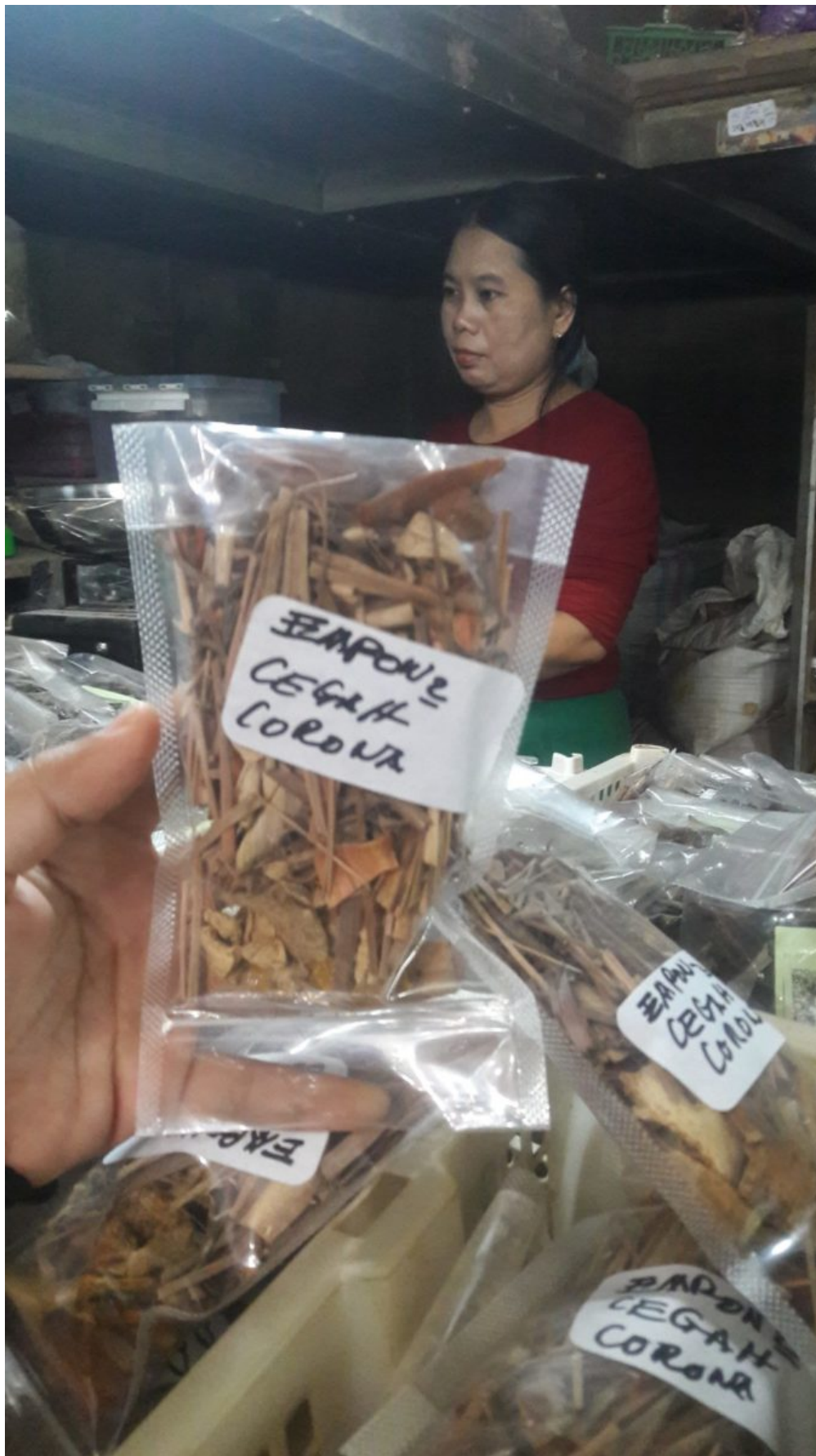
Hausgemachte Anti-Corona Jamu -Kräutermedizin, verkauft auf dem Beringharjo-Markt in Yogyakarta

Die jüngste Geschichte liefert einige gute Gründe, warum medizinische Fachkräfte, Patient*innen