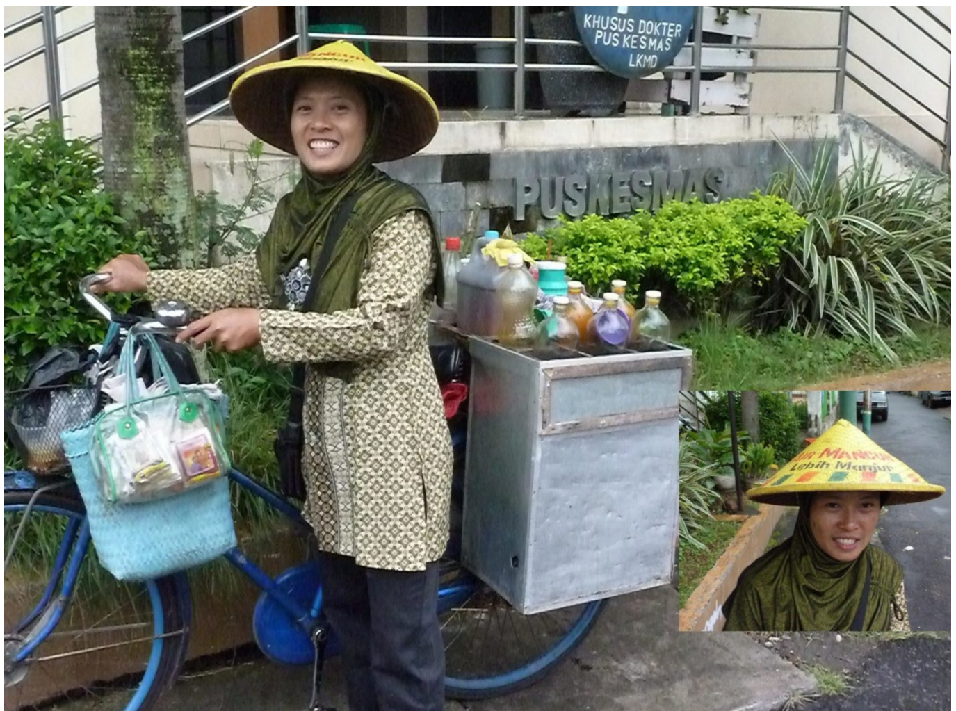
Eine Jamu Gendong Verkäuferin (gendong = tragen) trägt auf ihrem Caping Gunung (traditioneller

Spätestens an dieser Stelle wurde deutlich, dass Gesundheitshandeln kein eindimensionaler Prozess ist, sondern komplexe äußere Einflüsse, Dynamiken und medizinische Traditionen darin eine Rolle spielen. Die Herausforderungen der Covid-19-Pandemie können somit aus verschiedenen medizinischen Perspektiven betrachtet werden, die sich nicht notwendigerweise gegenseitig ausschließen. Während die WHO grundlegend aus einem biomedizinischen Verständnis die Beurteilung der aktuellen Pandemie vornimmt, handelten einige indonesische Politiker*innen ebenso wie viele Bürger*innen aus einem traditionell javanischen Medizinverständnis heraus. Anstatt die Aufrufe von Jokowi und anderen indonesischen Funktionsträgern sowie das damit verknüpfte humorale Körperverständnis, das auf den Körpersäften und den damit verbundenen vier Elementen beruht, rundweg abzulehnen, könnte ein Blick in den medizinischen Pluralismus Indonesiens und die damit verbundenen informellen Kooperationen im Gesundheitssystem sehr lehrreich sein.